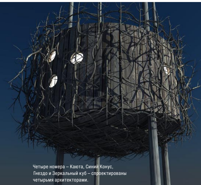
Четыре номера – Каюта, Синий Конус, Гнездо и Зеркальный куб – спроектированы четырьмя архитекторами.