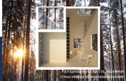
Разгадка фокуса проста: наружные стены номера облицованы зеркалом.

В октябре в Treehotel откроют номера НЛО и Room With a View.