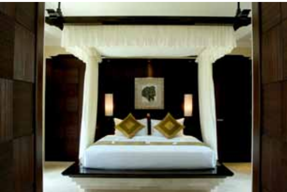
1,2,3,4 огромный спа Aquatonic, интерьер виллы и The Rock Bar и ресторан Sami Sami в отеле Ауана 5. часть храмового комплекса Pura Teguh Kogiran 6. священный обезьяний лес в Убуде Слева: трансовый танец кечак