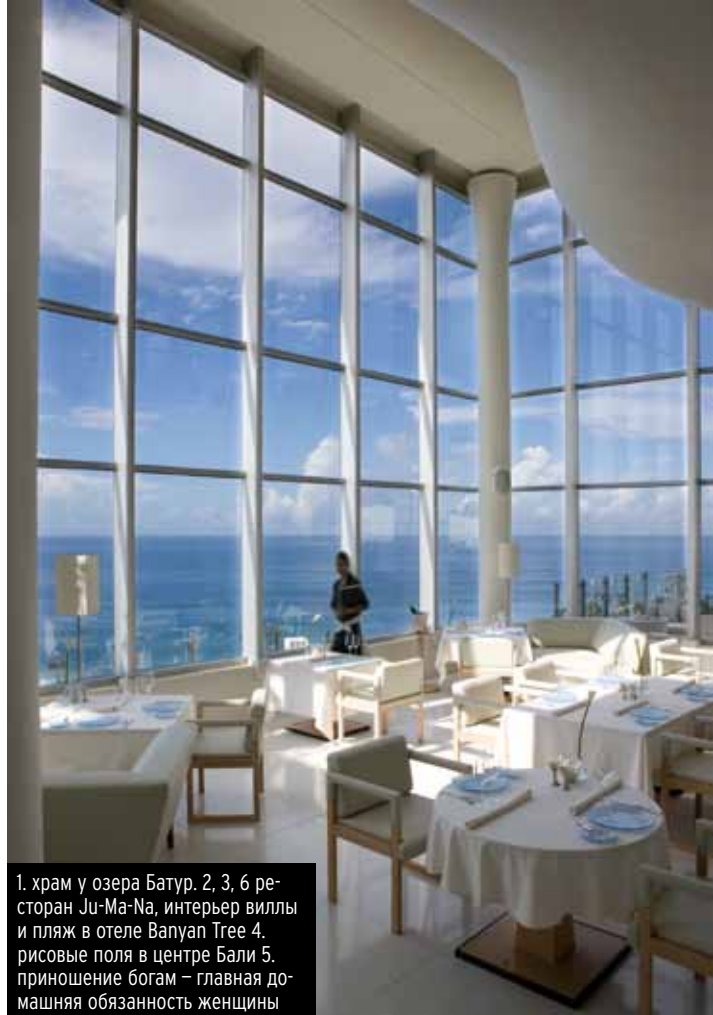
1. храм у озера Батур. 2, 3, 6 ресторан Ju-Ma-Na, интерьер виллы и пляж в отеле Banyan Tree 4. рисовые поля в центре Бали 5. приношение богам – главная домашняя обязанность женщины